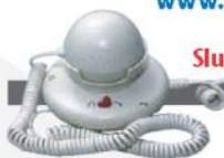
Sluchátko pro odposlech CLA 1