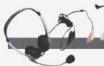
Náhlavní souprava pro pohodlný poslech CLA 3